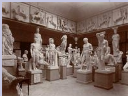
Jules-Alphonse Terpereau, Musée archéologique de la faculté des lettres de Bordeaux, vers 1886